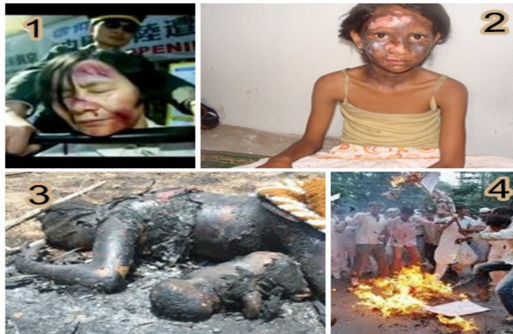
1- Missionária torturada na Coreia do Norte. 2- Menina cristã queimada durante perseguição religiosa em Orissa, na Índia. 3 – Cristã queimada viva com seu filho. 4 – Queima de Bíblias Sagrada.

organizações mais responsáveis pela violência contra os cristãos. Essas organizações, muitas vezes referidas coletivamente sob o nome de sua organização encoberta, o Sangh Parivar e meios de comunicação locais estiveram envolvidos na promoção de propaganda anticristã em Gujarat. O Sangh Parivar e organizações relacionadas afirmaram que a violência é uma expressão de "raiva espontânea" de "vanvasis" contra "conversões forçadas" através de atividades realizadas pelos missionários. Estas alegações foram contestadas pelos cristãos, que as descrevem como uma crença mítica e propaganda da parte de Sangh Parivar; tanto mais, que, segundo os cristãos, para Sangh Parivar, todas as conversões são uma "ameaça à unidade nacional".