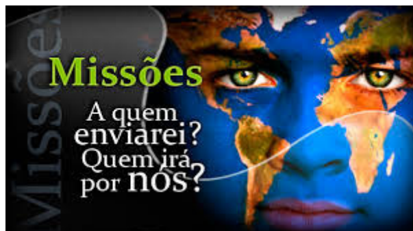
Missão, um projeto de Deus para ganhar o mundo

Missões é um projeto de Deus para salvar a humanidade; está no coração de Deus, e tem que estar também no nosso.