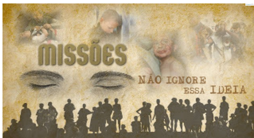
Missão: Preguemos o evangelho a toda criatura, começando por nossos lares

Vamos atentar mais para o ide de Jesus. Talvez falamos ou pensamos todos os dias, “ Maranata, ora vem Senhor Jesus! ”, “ Volta logo Jesus! ”, esquecendo-nos de que Jesus disse que enquanto o evangelho não fosse expandido a todos Ele não voltaria para buscar Sua igreja (“ E este evangelho do reino será pregado em todo o mundo, em testemunho a todas as nações, e então virá o fim. ” Mateus 24:14 ).