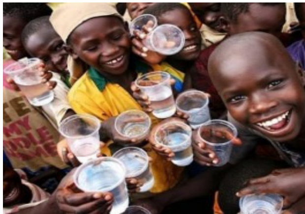
"Missão Internacional Água" projeto criado por igrejas em 2001 que ajuda a levar água potável para comunidades desfavorecidas ao redor do mundo.

Se abençoarmos os nossos missionários com alimentos e agasalhos para que o mesmo repasse para os necessitados, estamos ajudando de alguma forma para que o missionário e os necessitados tenham condições de viver uma vida melhor, falar e ouvirem de Jesus.